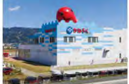
28 かねふくめんたいパーク伊豆

「わさびを、もっと、おもしろく」を合言葉に、日本で唯一室内栽培の豊石式わさび田から、創業より変わらぬ味のわさび漬まで。伊豆名産品わさびの全てがここに!