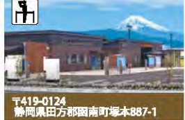
24 道の駅 道の駅 かなみ 伊豆ゲートウェイ函南

標高191mの小さな山ながら、ハイキングはなかなかハード。しかしがらんと登れば山頂からは富士山や箱根連山、駿河湾までを見渡せます。