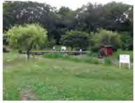
8 柏谷公園 かしやこうえん

富士山が一望できる柏谷の丘陵地に、露天風呂や打たせ湯など八種類のお風呂と歩行浴・プールなどが完備されたお湯のテーマパークです。軽食・喫茶などもOK。