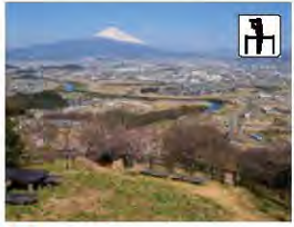
10 日守山 ひもりやま

懐かしい田舎風景の温泉宿。伊豆唯一の環境省指定国民保養温泉でもあり、古くから湯治場としても親しまれています。