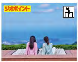
4 十国峠 じっこくとうげ

ビート・ダイの設計による美しく、アンジュレーションに富んだ18ホール。富士・箱根・駿河湾を見ながら、ハイスコアめざし果敢にチャレンジ!