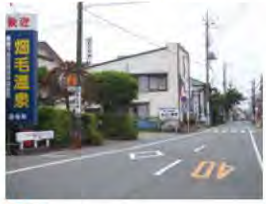
9 畑毛温泉 はたけおんせん

野球場・多目的広場・イベント広場等も整備、からくり時計も人気。スポーツ・散策に。