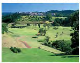
3 かなみスプリングスC.C.

仰ぎ見る富士山が眼下に広がる駿河湾がプレーヤーの心をとらえます。雄大な自然に包まれながら、個性豊かな富士18ホールと箱根18ホールがこの上ない時間を提供します。