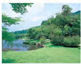
1 原生の森公園 げんせい もりこうえん

原生林(入山禁止)の下に位置する原生の森公園の展望台からは、美しい駿河湾、富士山などが見られます。人工池・遊歩道が整備され散策も楽しめます。