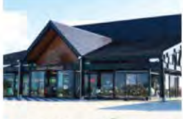
34 バイカーズパラダイス

かねふくが運営する明太子専門のテーマパーク。できたての明太子が買える直売店やフードコーナー、工場見学、キッズコーナーなどお子様から大人まで楽しめます!