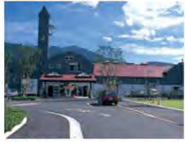
6 酪農王国オラッチェ ちくのうおうこく

富士山を望む山麓にある公開天文台。化石・地学の展示やプラネタリウムもあり、雄大な自然について楽しく学べるスポットです。