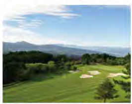
2 函南ゴルフ倶楽部 かんなみ くらぶ

原生林(入山禁止)の下に位置する原生の森公園の展望台からは、美しい駿河湾、富士山などが見られます。人工池・遊歩道が整備され散策も楽しめます。