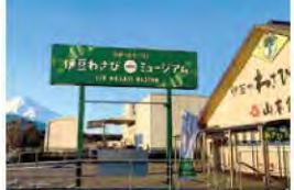
27 伊豆わさびミュージアム

「まなぶ」「あそぶ」「つながる」をテーマに、野狩川の水辺を活用した憩いの場。川遊びや、ドックラン、芝生広場は心身のリフレッシュに最適な空間です。