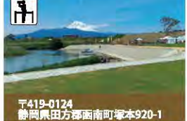
25 川の駅 川の駅 かなみ 伊豆ゲートウェイ函南

伊豆の玄関口にできた道の駅。伊豆の「ヒト」「モノ」「コト」が集まる情報基地。地元の魅力を紹介した土産販売所や飲食店が並び、富士山の眺望も抜群です。