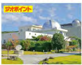
5 月光天文台 げっこうてんもんたい

380度まさに絶景スポット。標高766mからの眺望はケーブルカーに乗り山頂まで約3分です。ペットはリード着用で乗車OK。山頂にはドッグランも併設。